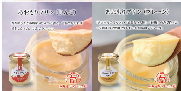
あおもりプリン(りんご)

青森のりんごの風味がほんのり香る、青森でなければ できなかった、りんごのプリン。